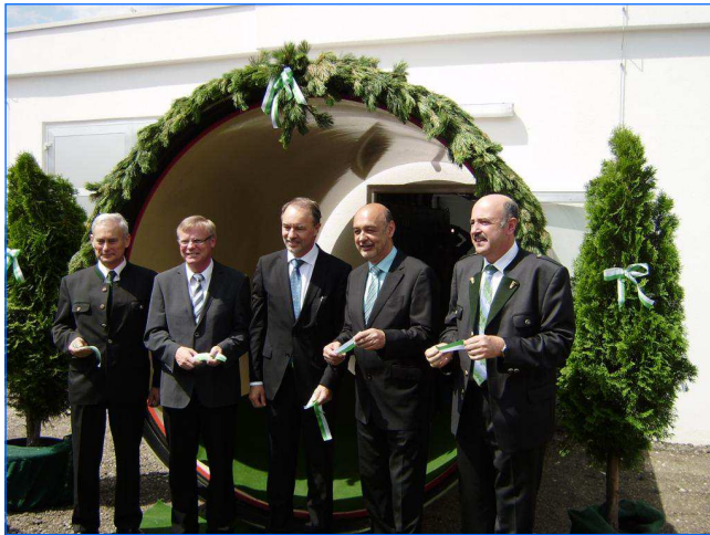
Eröffnungsfeier Opening ceremony