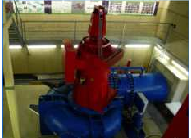
Fertig installierte Turbine turbine mounted in powerhouse