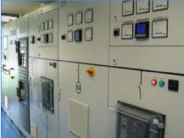
Elektroschaltanlagen low voltage switch boards