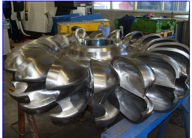
Peltonlaufrad Pelton runner